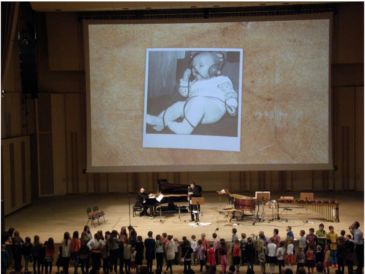
Zdjęcie powyżej: Koncert w Filharmonii Świętokrzyskiej w Kielcach.